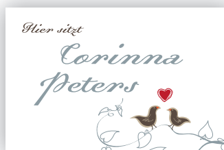
...einer Tischkarte (85x55 mm Klappkärtchen)